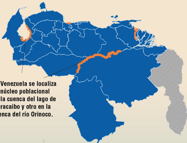
En Venezuela se localiza un núcleo poblacional en la cuenca del lago de Maracaibo y otro en la cuenca del río Orinoco.

Se distribuye desde el sureste de los Estados Unidos hasta la boca del río Amazonas en Brasil, en zonas costeras del mar Caribe y noreste de Suramérica, en las Antillas Mayores, y en las cuencas de los ríos Cauca y Magdalena en Colombia y Orinoco en Venezuela. En Venezuela se localiza un núcleo poblacional en la cuenca del lago de Maracaibo y otro en la cuenca del río Orinoco. Aunque no parece existir una población residente en las costas venezolanas, se ha reportado su presencia en Puerto Cabello (estado Carabobo) y en la boca del río Neverí (estado Anzoátegui).